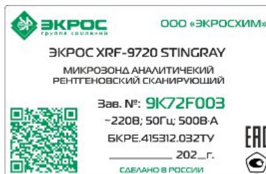
Рисунок 2 – Табличка микрозондов аналитических рентгеновских сканирующих ЭКРОС XRF-9720 STINGRAY