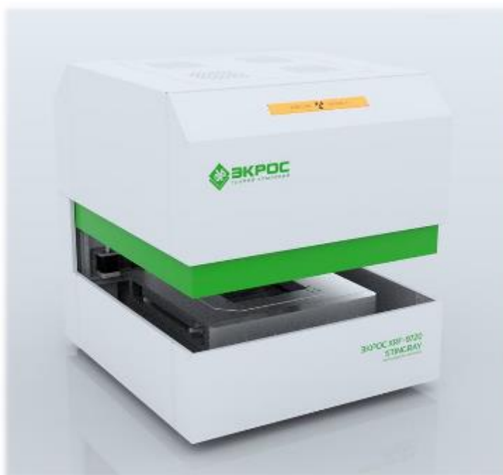
Рисунок 1 – Общий вид микрозондов аналитических рентгеновских сканирующих ЭКРОС XRF-9720 STINGRAY

Нанесение знака поверки на микрозонды не предусмотрено.