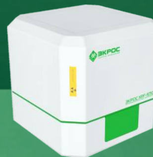
Компактный рентгенофлуоресцентный спектрометр ЭКРОС XRF-9710 «PEARL»