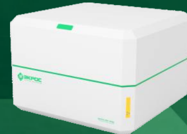
Энергодисперсионный рентгенофлуоресцентный спектрометр ЭКРОС XRF-9700 «STARFISH»