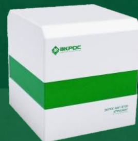
Рентгеновский аналитический микрозонд ЭКРОС XRF-9720 «STINGRAY»