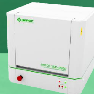
Рентгеновские настольные дифрактометры серии ЭКРОС XRD