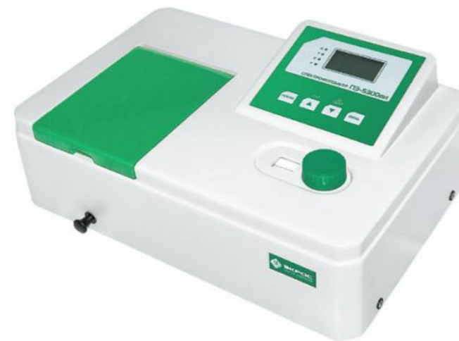
Спектрофотометр ПЭ-5300 ВИ