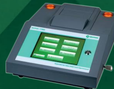
Энергодисперсионный рентгенофлуоресцентный анализатор серы в нефтепродуктах ЭКРОС -7700