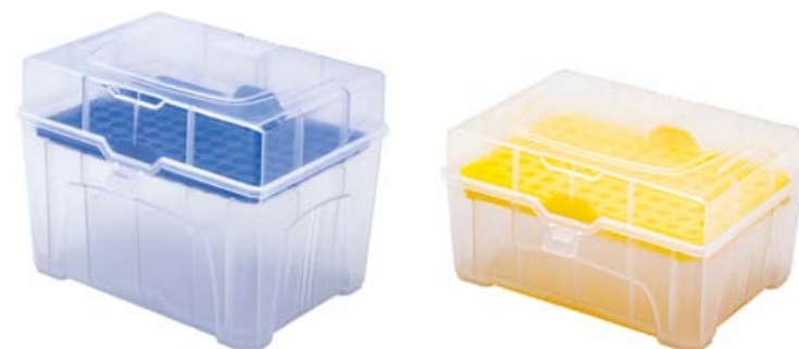
Штатив для наконечников 1000 мкл

Штатив для наконечников 100/200/250/300 мкл, 96 гнезд ПП код по каталогу 1.75.30.30.0093.ШН Подходит для наконечников 100 мкл, 200 мкл, 250 мкл, 300 мкл производства ЭКРОСИМ