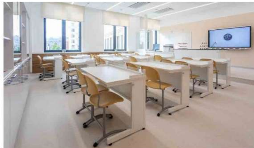
«Газпром школа Санкт-Петербург», кабинет химии