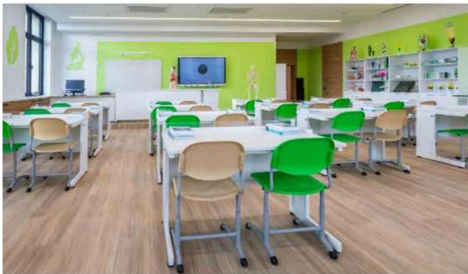
«Газпром школа Санкт-Петербург», кабинет биологии