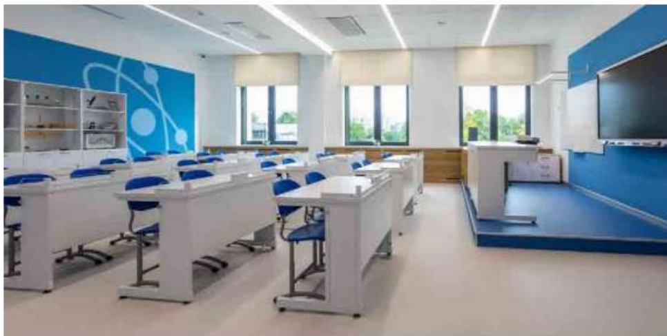
«Газпром школа Санкт-Петербург», кабинет физики

«ЭКРОС» – ЛАБОРАТОРНЫЕ КЛАССЫ ДЛЯ БУДУЩЕГО РОССИИ