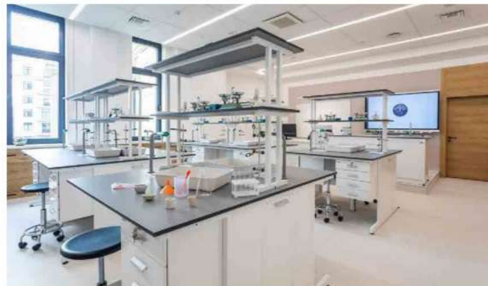
«Газпром школа Санкт-Петербург», кабинет химии